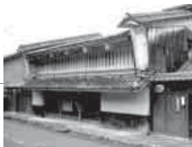
▲京藤甚五郎家（お茶席、琴の演奏）