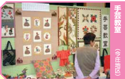
手芸教室 (今庄地区)

大正琴の音符はド、レ、ミ…ではなく1、2、3…で読むから比較的簡単で何歳からでも始められます。一人で弾いても、大勢でも楽しめます。