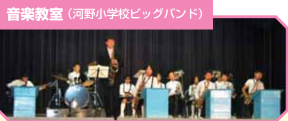
音楽教室 (河野小学校ビッグバンド)

こぶし回しなど、発表会できている人の歌を聞いて勉強しています。むずかしい歌が歌いきれた時は最高の気分です。