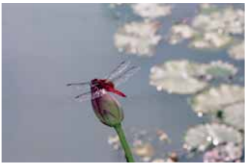
大賞 花ハス 可児 幸彦(岐阜県)