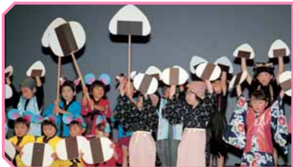
劇・おむすびころりん (南条幼稚園)

第2回町民文化祭が各地区で行われました。展示部門では、各教室や同好会、一般参加者などの作品が今年もたくさん展示され、訪れた人たちは力作の鑑賞を楽しんでいました。 また、舞台発表では、子どもから高齢者まで幅広い出演者が日頃の練習の成果を堂々と披露。今年は、他の地区への作品出展や舞台発表の出演などもありました。