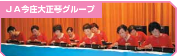
J A 今庄大正琴グループ

子ども達8人は新曲茶摘み歌を披露。振り覚えよく歌を聞いて踊るよう気をつけました。河野地区文化祭も出演。