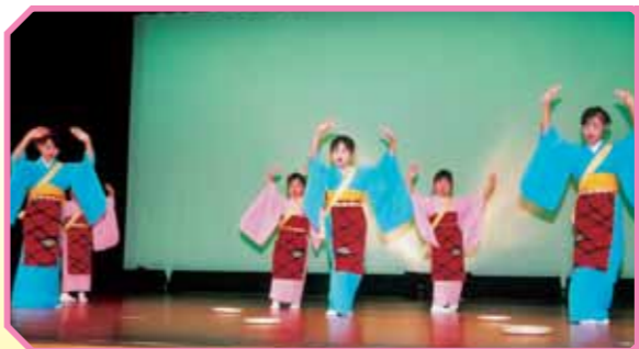
日本舞踊 (南条クラブ)

園児36人が総出演。文化祭に発表するため猛練習、一人ひとりが台詞を覚え劇をつなぎ楽しい劇に仕上がりました。