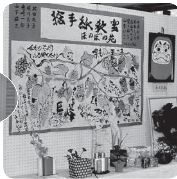
▲ほのぼの苑作品展