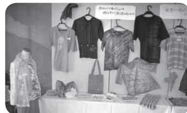
▲草木染教室&あかね展