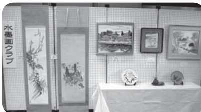
▲水墨画クラブ墨彩会展