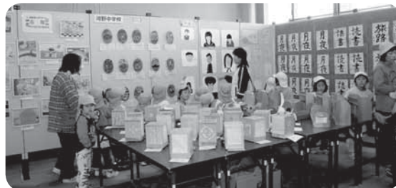
▲河野小・中学校作品展

11月2日から4日にかけて町民文化祭が各地区会場で行われました。日頃の成果を披露する舞台発表や、力作の揃った展示に訪れた人たちは見入っていました。