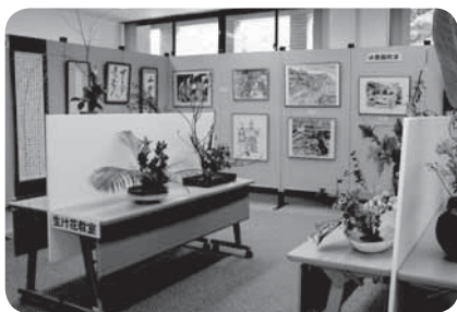
▲河野地区公民館教室展示