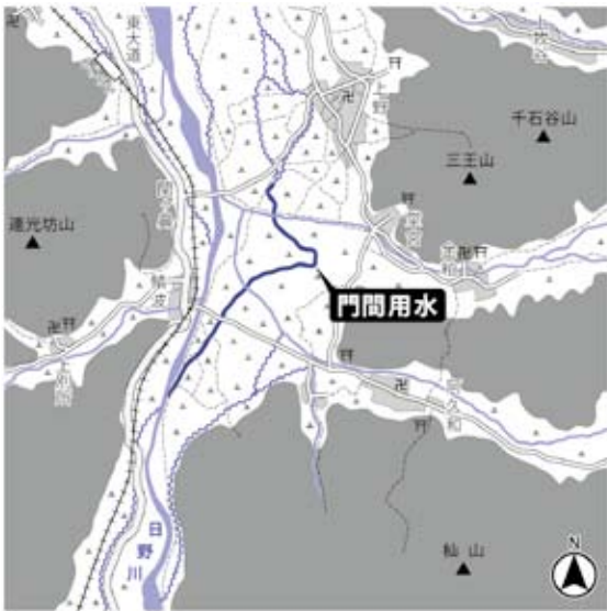
▲門間用水の推定位置(明治時代の地図をもとに復元)

しかし、上野村まで水を引くためには鯖波・阿久和・中小屋村の田畑を潰して水路を造らなけ