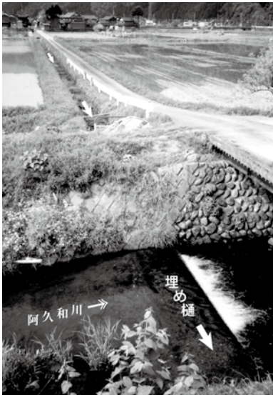
▲途中の川には埋め樋を設け水を流していた

門間用水は、元和4年(一六一八)上野村(当時は杣山村)の井元藤兵衛が、福井藩主松平忠直に直訴し、家老本多富正の仲裁を得て造られた用水です。日野川をせき止め取水し、幅約13m、延長約2kmの水路を造る大事業でした。