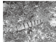
▲しま模様がかわいいキヌバリ