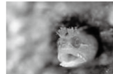
▲愛らしいコケギンポ