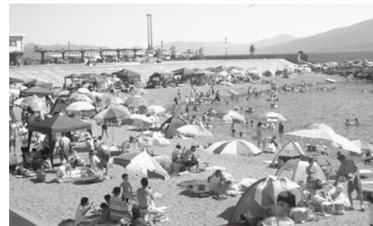
▲海水浴客でにぎわう甲楽城海水浴場