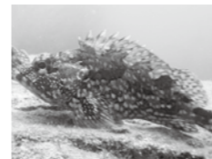
▲大きな目が魅力的なナカサゴ