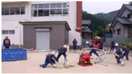
朝早くから訓練を積んでいます!

団員たちは 4 月中旬から練習を始め、大会本番に向け長期間練習に励んでいます。 練習は、毎週 4 日(月、火、木、金)の早朝 4 時半から午前 7 時まで湯尾小学校グラウンドで行っていますので、皆様のご声援をよろしくお願いします。(雨天時は大門スノーシエット内) 大会でのご健闘をお祈りします。頑張ってください。