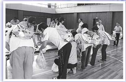
▲永平寺町上志比小学校への広域避難訓練