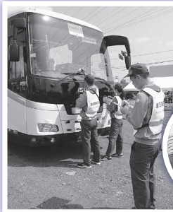
◀▼サンドーム福井駐車場でスクリーニング検査訓練