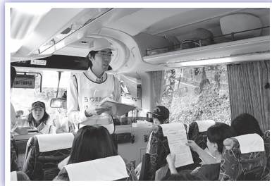
▲安定ヨウ素剤配布訓練