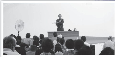
▲河野小学校に設置した放射線防護施設(エアシェルター)への要配慮者一時避難訓練

8月30日、31日に河野地区全域を対象に福井県と合同で原子力総合防災訓練を実施しました。地震による美浜原子力発電所の事故発生を想定し、原子力災害時の協定先である永平寺町への広域避難訓練と河野小学校放射線防護施設への要配慮者一時避難訓練等に河野地区の住民約200人が参加し、原子力災害時の避難行動等について理解を深めました。