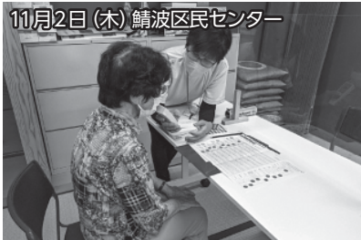
11月2日（木）鯖波区民センター