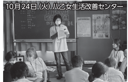
10月24日（火）八乙女生活改善センター