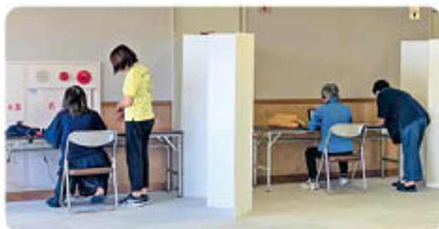
「脳の健康度測定」会場の様子