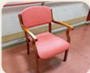
ご寄付いただいた65型液晶テレビと肘掛付チェア