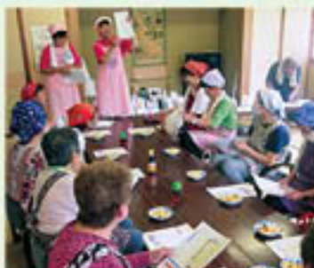
集落生活習慣病予防教室の様子

食改さんは、食生活改善推進員の愛称で、食を通して町の健康づくりをサポートする活動を行っています。