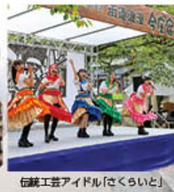
伝統工芸アイドル「さくらいと」