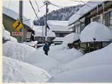
前町合併10周年記念式典