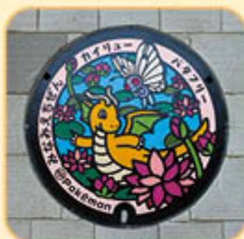
南越前町の「ポケふた」

この取り組みは、ポケモンたちの魅力と各地域の魅力を知っていただくことを目的に、一枚一枚をオリジナルでデザインし、世界に一つだけのマンホールとして全国各地に設置されています。なお、この「ポケふた」は、南越前町に來ないと見られない貴重な「ポケふた」です。