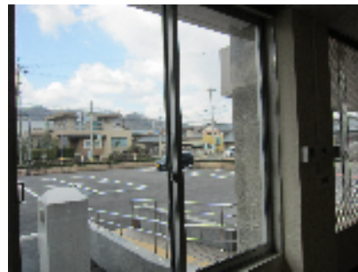
既存サッシュを利用したペアガラス工法