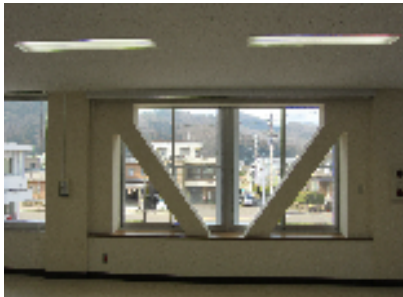
耐震ブレスによる耐震補強