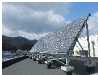
太陽光発電の設置