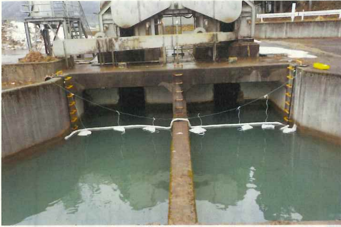
八乙女取水口吸着マット取付(令和5年2月)

河川に油類が流出した場合、地元市町、関係県土木事務所、国土交通省、消防署、保健所、警察署等が出動し、原因調査や油の回収・処理に当たります。オイルフェンスやオイル吸着マットの敷設には多額の費用がかかり、 その費用は油を流した人の負担 となります。また、農業や漁業にも影響を及ぼす場合は、その被害の補償など、多額の賠償金を請求される可能性もあります。