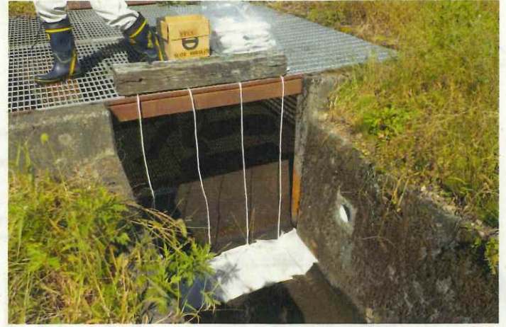
水路への吸着マット取付(令和3年9月)