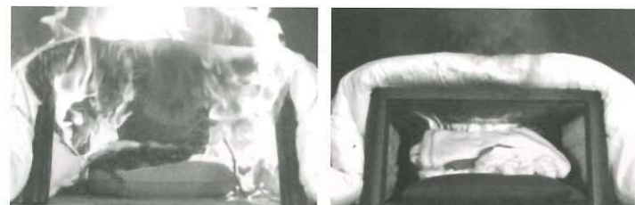
★こたつ布団や座いす、座布団がこたつ内のヒーターユニットに触れないように注意!