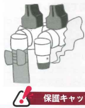
【ガス栓】 ガス漏れに注意