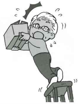
【踏み台】 バランスを崩して転倒