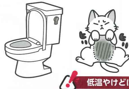
【暖房便座】 使用中に低温やけど