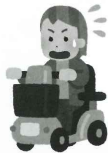
【電動カート】 運転を誤って事故