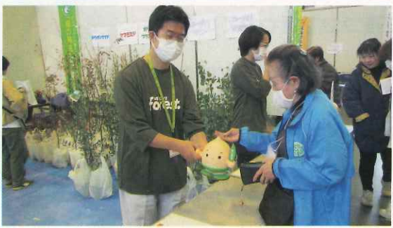
緑化苗木の配布 (敦賀市)