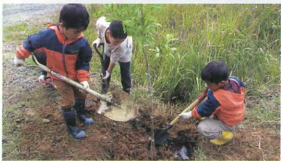
子ども達の森林学習 (若狭町)