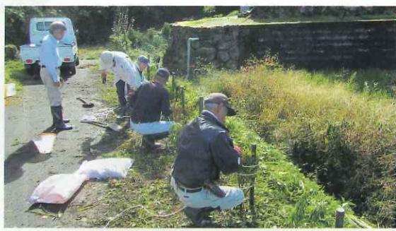
地域での植樹活動 (南越前町)