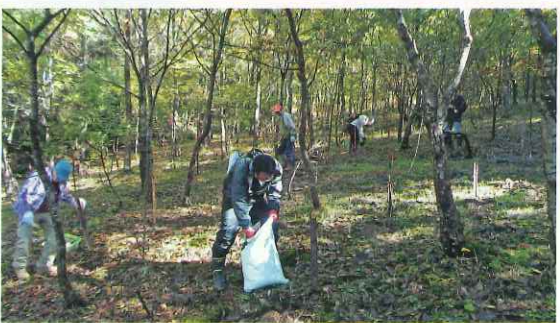
ボランティアによる森づくり活動 (永平寺町)