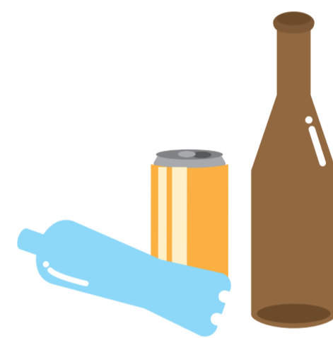
屋外に放置された空きビン・缶・ペットボトル