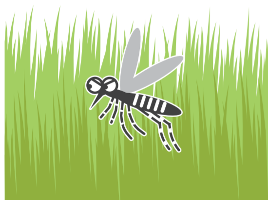
風通しの悪いやぶ・草むら

公園、学校、寺社、空海港、駅などの施設を管理されている方もご協力をお願いします!