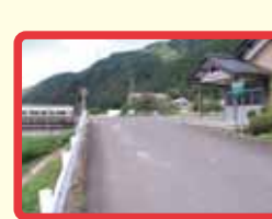
12 合波公民館前 (見通し悪い)