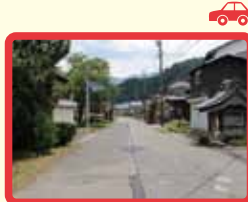
5 道路が狭くなって いる上に、住宅がある ため見通しが悪い。 集落内の細い道から 自動車が出てくる場 合、通行している自 転車などを認知しに くい。