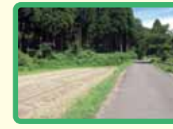
14 集落間の民家のない場所 (熊・イノシシ出没)