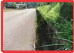
3 南今庄～下新道 (側溝深い・ラインなし)