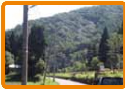
1 今庄杉津線全線 (防犯灯少なく暗い)