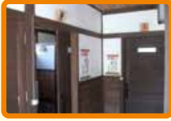
7 南今庄駅トイレ (不審者)