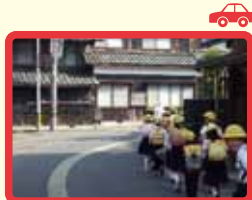
5 カーブしていて見通しが悪い