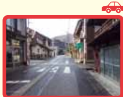
6 交差点の見通しが悪い