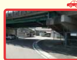
8 カーブが深く見通しが悪い