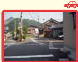
7 5つの道が交差している