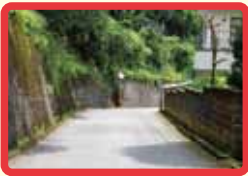
9 道路が狭く、見通し が悪い。