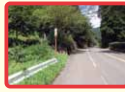
13 大門～孫谷、合波～大門農道 (防犯灯少なく暗い)