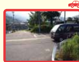
10 合流する車に注意