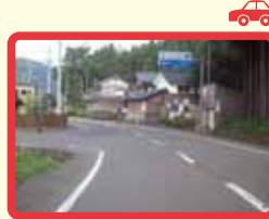
3 長沢より奥 (交通量多) 通学路でない。