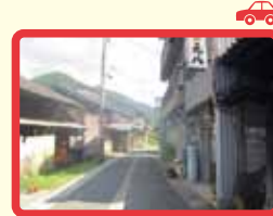
9 道路が狭く見通しが悪い