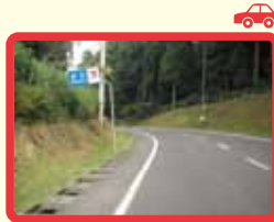
2 久喜～長沢のカーブ (見通し悪い) 通学路でない。