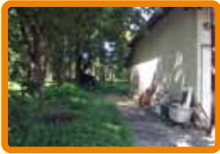
5 日の出倉庫付近 (不審者)