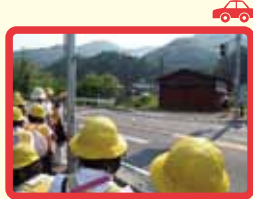
2 左右を確認して横断