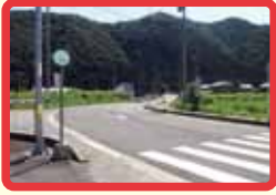
8 国道～県道入り口 (カーブ急危険)