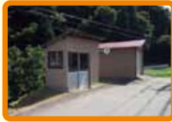
4 バス停付近(不審者)