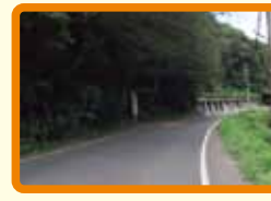
15 集落間の民家のない場所 (不審者)