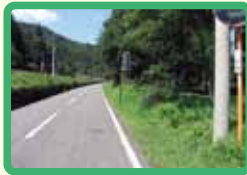
2 今庄杉津線全線 (熊・イノシシ出没)