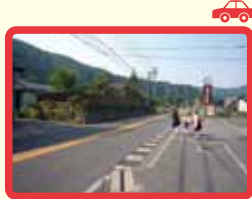
1 車の通行量が多い