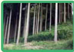
8 宅良全域(熊・イノシシ出没)