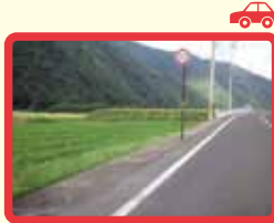
4 長沢476号線(ガード レールなく危険) 通学路でない。