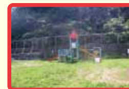
15 山肌近くが崩れる恐れがある