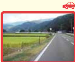
6 スポーツパーク476 北側道路(ガードレ ールなく危険)