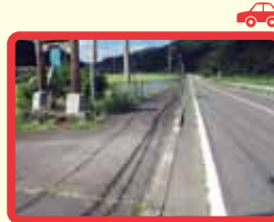
11 国道365号と合波橋の交差点 (段差あり危険)