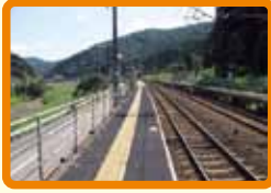
6 南今庄駅ホーム (不審者)