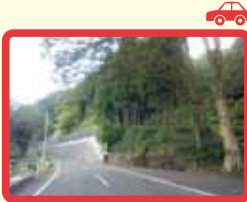
1 八乙女～社谷間山道 (道路外側ライン なく危険)