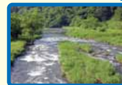
11 川の流れがはやい