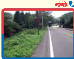
10 日野川沿い (防犯灯少なく暗い・雨天時滑りやすい)