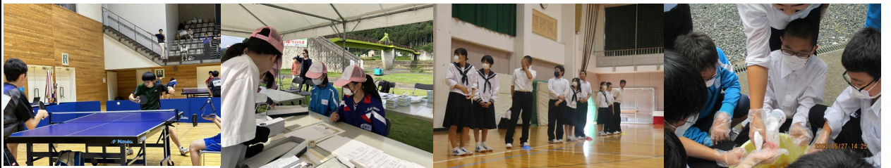
6/23 中体連の大会(男卓)