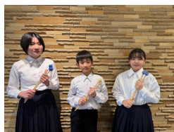
打楽器3重奏 「精霊の詩」