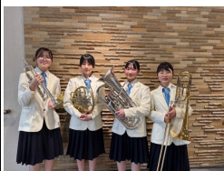
金管4重奏 「4つの小品」

とても緊張したと思いますが、素晴らしい演奏を聴かせてくれました。吹奏楽部のみなさんお疲れ様でした。