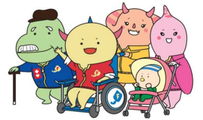
共生社会シンボルマーク