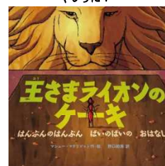
王さまライオンのケーキ