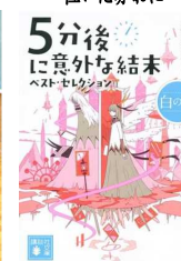
5分後に意外な結末「失った財産」