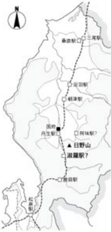
越前国の駅家推定地

平安中期の法令集『延喜式』によると越前国には八駅が設置され、松原駅、鹿蘇駅に続く三番目に「淑羅駅」の名がみえ、続いて阿味駅、丹生駅となっています。駅の所在地については諸説があり、日野川を古くは淑羅川と書き「シクラガワ」「シラキガワ」と読んだことから、淑羅駅は鹿蘇駅（南越前町南今庄付近）から丹生駅（越前市丹生郷町付近）までの日野川流域に比定されています。書を引けば、「淑」は「美しい」「じとやか」を表し、「羅」は「薄絹」「連なる」を表すなど、淑羅は美しく淑やかな景観が連なった地域を形容した地名と思われます。日野川流域で風光明媚なところといえば必然的に日野山があげられ、より良い形が眺められる