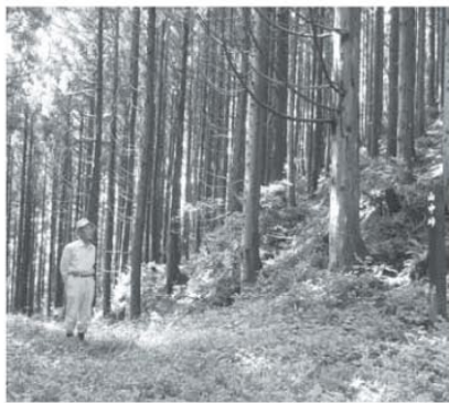
▲山中峠の南越前町と敦賀市の尾根境

後に残る私を思ってくださいならば。 奈良時代初めの天平十八年（七四六）、大伴家持は、二十九歳で越中守となり伏木（現高岡市）に着任しましたが、その二年後、奈良の都からの