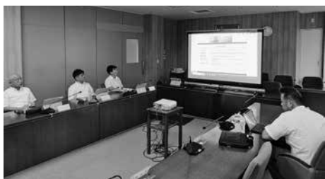
情報セキュリティ研修

8月5日、本庁3階第一委員会室にて、情報資産の保護及び住民の安心と信頼の確保を目的とした情報セキュリティ研修が実施されました。研修は、本庁3階第一委員会室にて、情報資産の保護及び住民の安心と信頼の確保を目的とした情報セキュリティ研修が実施されました。研修は、本庁3階第一委員会室にて、情報資産の保護及び住民の安心と信頼の確保を目的とした情報セキュリティ研修が実施されました。