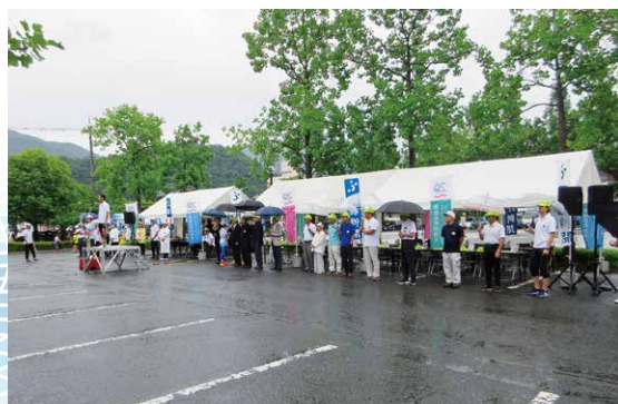
花はす早朝マラソン