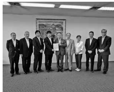
県知事への要望活動

●8月20日 公立丹南病院組合議会本会議が鯖江市役所で開催され、組合議員3名が出席