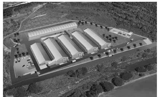
(株)デイリーエッグツチダ南越前農場完成予想図

●6月12日 (株)デイリーエッグツチダ南越前農場採卵鶏飼養管理施設地鎮祭が(株)デイリーエッグツチダ南越前農場で開催され、議長が出席