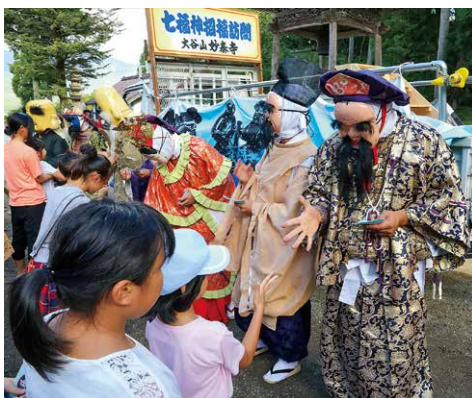
子供たちとのふれあい（境内にて）

私たち七福神保存会は町の伝統文化の一つである、七福神奉納踊りを後世に守り伝えるべく活動しています。現在では、町民の方々に広く知っていただくため、9月の明神会だけで披露されていた奉納踊りを町の文化祭や産業物産フェア、福井元氣シルバーフェスタ2023 in 南越前などでも披露しています。