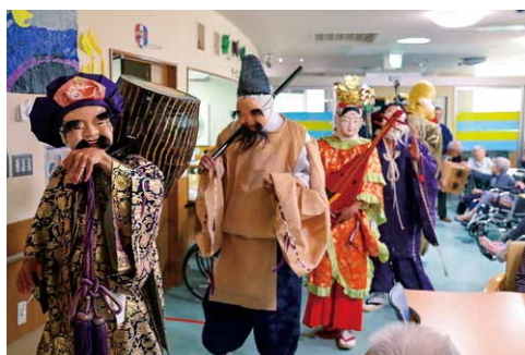
招福訪問（ほのぼの苑）

七福神祭り（明神会）は毎年9月の敬老の日に開催され、祭礼当日には地元地区への七福神招福訪問が行われます。祭礼が始まりますと、露払い役の天狗（猿田彦大神）・やっこ・おふく・獅子の先導で七福神が登場し、明神会の法要には奉納踊りが披露されます。奉納踊りは、大黒天・恵比寿天・