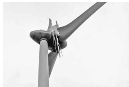
能登半島地震により破折落下した風力発電機