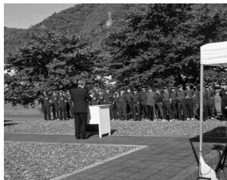
消防操法大会祝辞

●7月7日 自警消防隊連絡協議会消防操法大会が今庄中部地区農業集落排水処理施設前広場で開催され、議長ほか総務文教厚生常任委員1名が出席