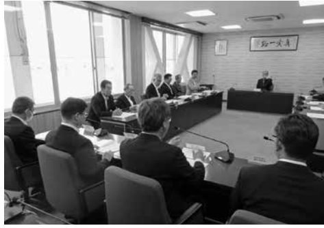
丹南地区市町議会議長会定期総会の様子

●5月9日 丹南地区市町議会議長会定期総会が南越前町役場で開催され、正副議長が出席