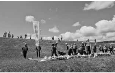
九頭竜川水系総合水防演習

●5月26日 第37回今庄そばまつりが今庄宿を中心に開催され、正副議長ほか議員8名が出席