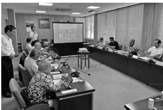
ペーパーレス会議システム実演会

6月13日、本庁3階第一委員会室にて、県内他市町にペーパーレス会議システム導入実績のある2社を招き、実演説明会を開催しました。今後は9月議会定例会から運用開始できるよう、導入を進めていきます。